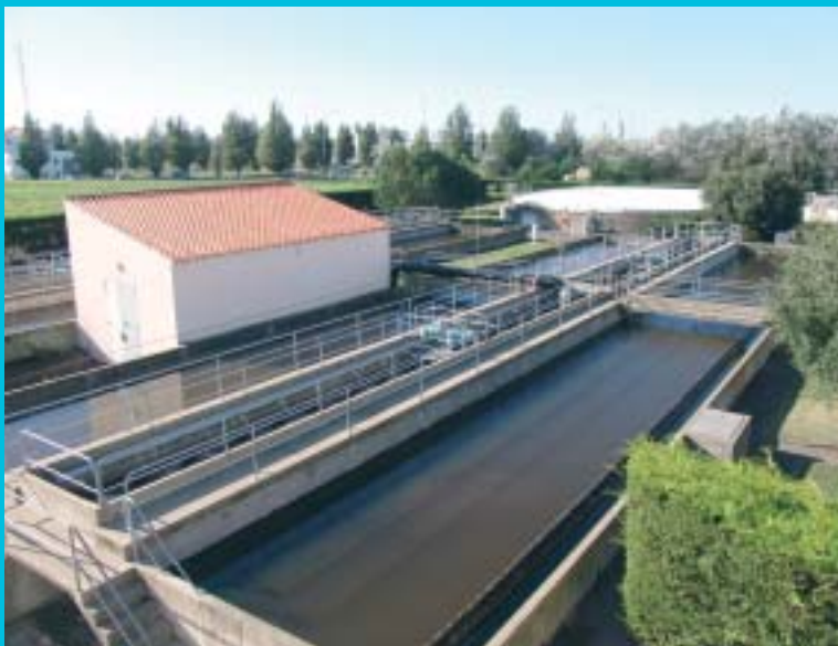
La station d'épuration de la Sablière est insuffisante par rapport à la taille de l'agglomération, particulièrement avec la fréquentation estivale.

Le coût global s'élève à 45 millions d'euros. L'Agence de l'Eau apportera une subvention de 37 % ●