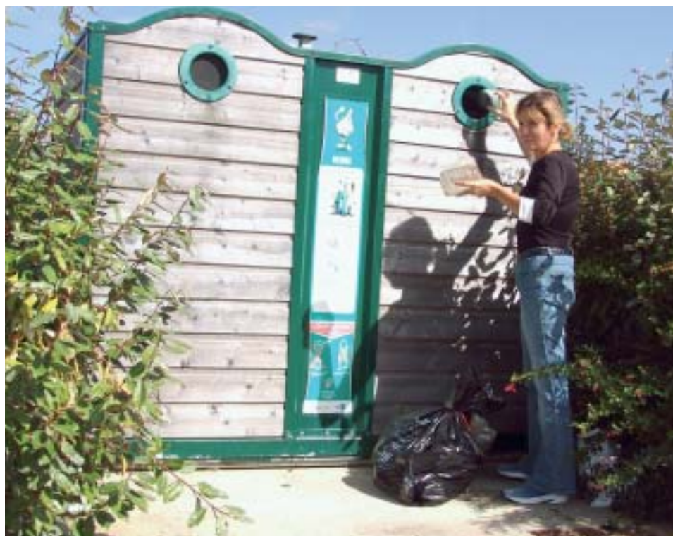
Le tri sélectif, un geste citoyen pour l'environnement.

Au nom de l'environnement, la filière d'élimination des ordures ménagères se réorganise. La Communauté de Communes assume, à la place des communes, toute la collecte, sur toute l'agglomération.