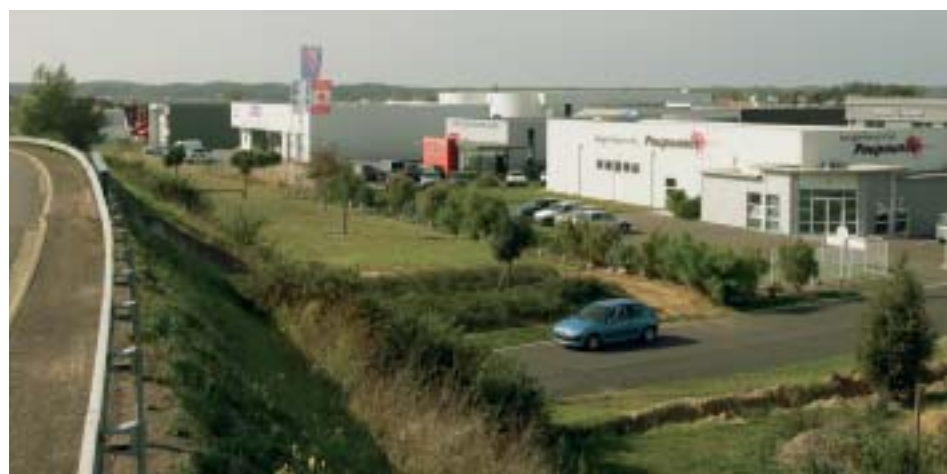
La rocade dessert directement le Parc Actilonne.

Enfin, le parc Actilonne s'affirme comme base d'appui pour ceux qui ont l'esprit d'entreprendre. Il est le siège de la pépinière d'entreprises et, bientôt, d'un village d'entreprises. Soit deux autres dispositifs communautaires propices au climat de création et d'essor des jeunes entrepreneurs ! ●