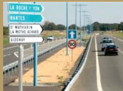
L'arrivée de la RN 160 valorise l'espace foncier environnant.

Du côté de La Vannerie et de la Burguinière, où aboutit la RN 160, se dessine une part de l'avenir de l'agglomération. Demain, cette zone pourrait être le cœur du développement économique et des infrastructures majeures. Sur cette « nouvelle frontière », la Communauté de Communes veut éviter constructions anarchiques et spéculation. Elle cherche au contraire à s'assurer d'une qualité environnementale, gage d'aménagements harmonieux. Elle étudie les affectations possibles de 100 à 150 ha à maîtriser. Elle y réserve, notamment, la place à un pôle santé associant l'hôpital et la clinique ●