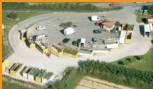
La déchetterie restera ouverte le temps des travaux

Huiles, papier, carton, verre, gravats, déchets verts... En 2003, les dépôts à la déchetterie des Fontaines, ont dépassé 13 450 tonnes, pour une fréquentation de 120 000 personnes. La déchetterie étant trop exiguë, une extension est prévue. Le nombre de bennes passera de 9 à 14. Parmi le « tout venant » on séparera ainsi le bois et les pneus. L'extension, 350 000 euros, est financée par la Taxe d'Enlèvement des Ordures Ménagères ●