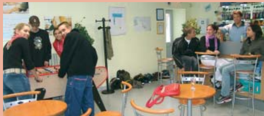
Le Cool Café, très fréquenté, en centre-ville des Sables d'Olonne.

Communauté de Communes et Ville des Sables d'Olonne s'impliquent ensemble dans les objectifs, le financement et la gestion de deux structures dont animation et encadrement sont confiés à des personnels diplômés spécialistes de l'écoute des jeunes et de l'animation.