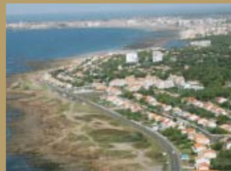
Le Pays des Olonnes au cœur du Pôle Touristique International.

L'activité touristique, en particulier en matière de promotion, s'organise à des échelons dépassant les limites locales. La Région et l'État incitent les collectivités à se regrouper pour la promotion internationale et l'accueil des clientèles. Ainsi la Communauté de Communes adhère-t-elle au Pôle Touristique International « Vendée Côte de Lumière » qui réunit les Communautés de Communes Auzance et Vertonne, Atlantica, Côte de Lumière et Pays du Talmondais ●