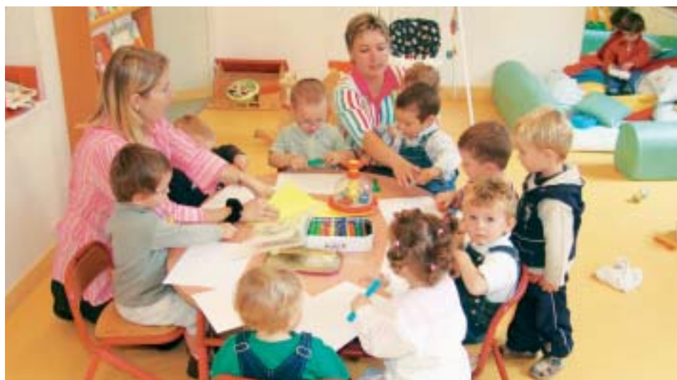
300 à 350 enfants domiciliés sur nos communes naissent chaque année au Pays des Olonnes.

Le manque de places en crèche pénalise la vie professionnelle des jeunes parents. Une structure multi-accueil va multiplier l'offre et répondre aux besoins diversifiés des familles.