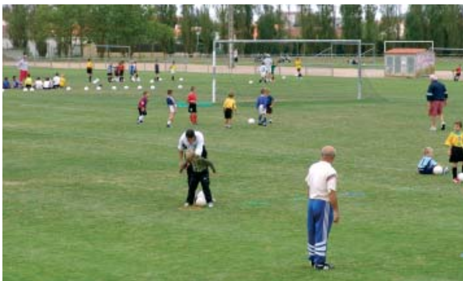
Les Chirons, un parc sportif de 8,5 hectares.

Parmi l'héritage du SIVOM transmis à la Communauté de Communes, le complexe des Chirons demeure le pôle majeur des pratiques sportives dans l'agglomération. La Communauté a développé aussi d'autres plateformes à La Guérinière et à La Rudelière.